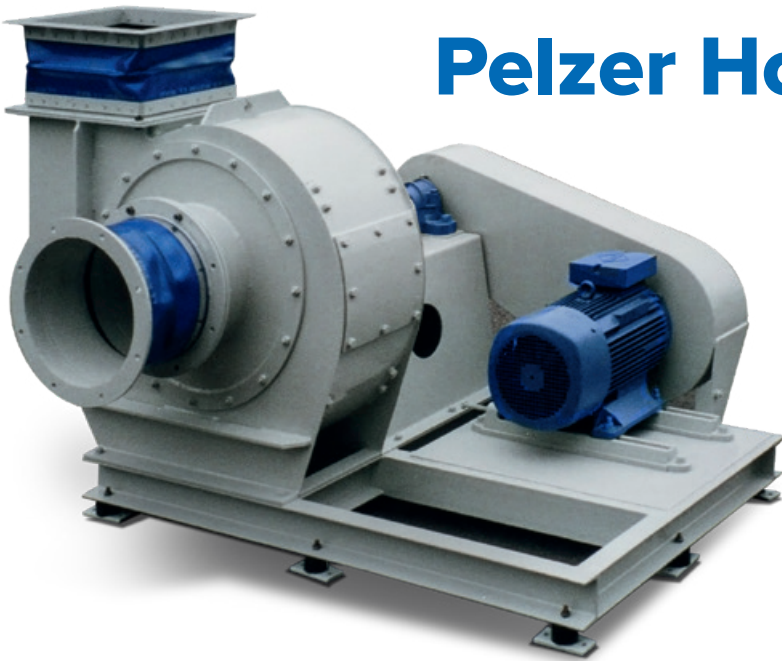
Kennlinie Ventilatorart PHD Drehzahl 2.900 1/min